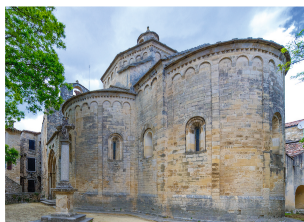
5 Tomber sous le charme de la place de l'église de Saint-Martin-de-Londres