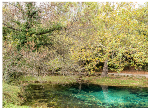
3 Pique-niquer à la source de la Buèges