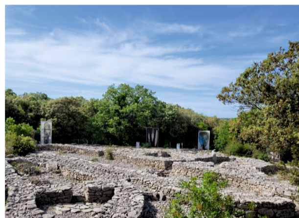
4 Remonter au temps de la préhistoire sur le site de Cambous