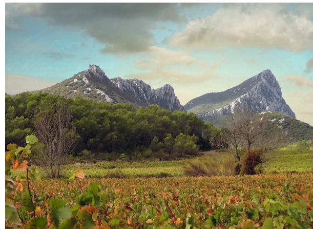
1 Prendre en photo le Pic Saint-Loup sous votre angle préféré