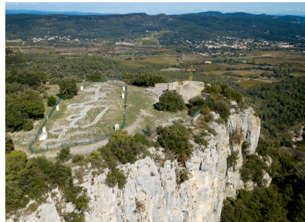
2 Observer les paysages autour du Rocher du Causse