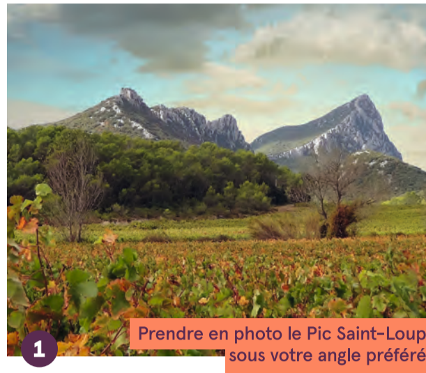
1 Prendre en photo le Pic Saint-Loup sous votre angle préféré