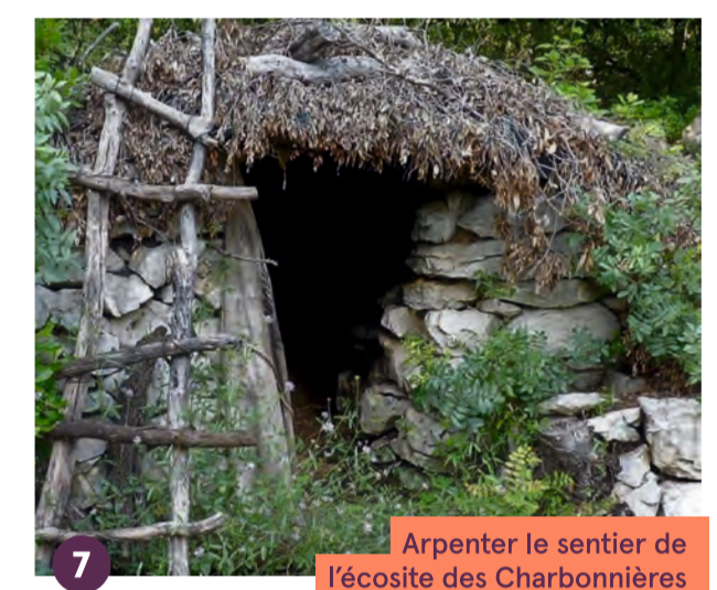
7 Arpenter le sentier de l'écosite des Charbonnières