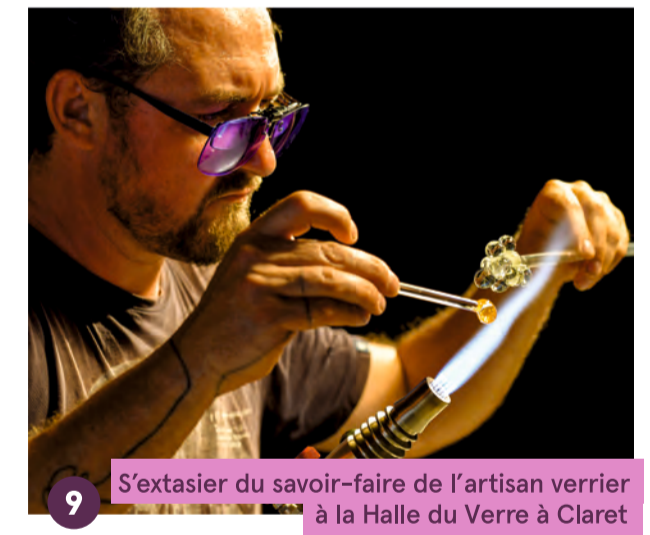
9 S'extasier du savoir-faire de l'artisan verrier à la Halle du Verre à Claret