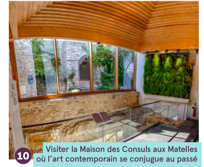
10 Visiter la Maison des Consuls aux Matelles où l'art contemporain se conjugue au passé