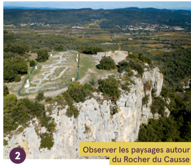
2 Observer les paysages autour du Rocher du Causse