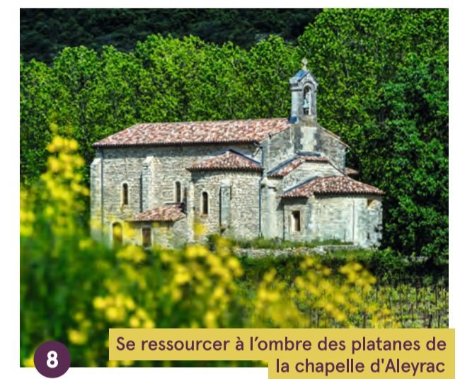
8 Se ressourcer à l'ombre des platanes de la chapelle d'Aleyrac