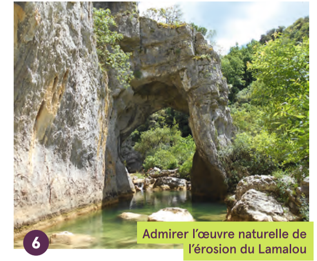
6 Admirer l'œuvre naturelle de l'érosion du Lamalou

Un site naturel est sensible, merci de le respecter