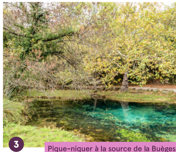
3 Pique-niquer à la source de la Buèges