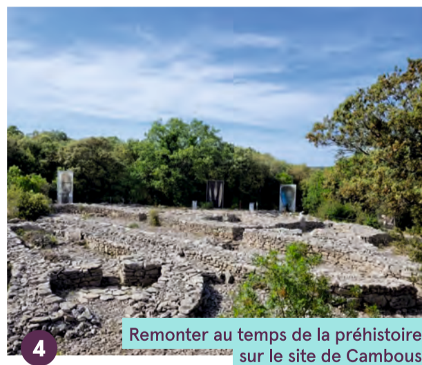
4 Remonter au temps de la préhistoire sur le site de Cambous