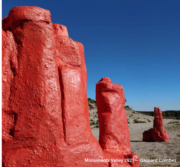
Monuments Valley 2021 – Gaspard Combes